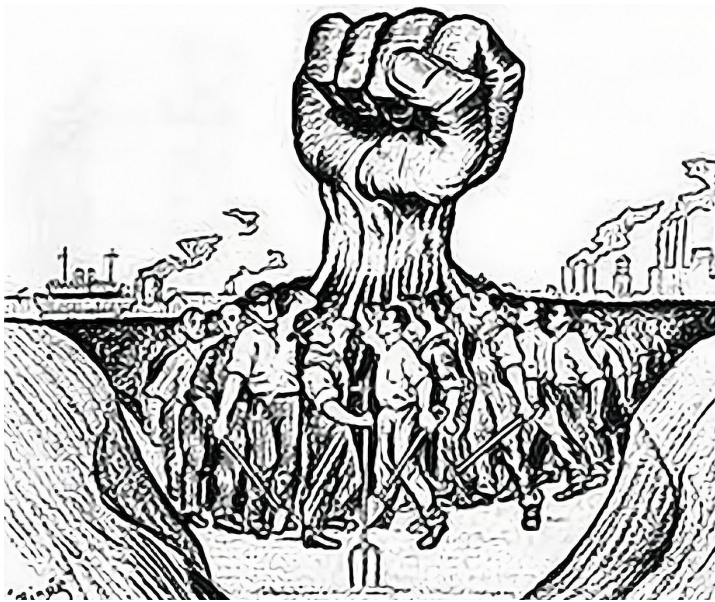
[Puño combatiente, clase trabajadora] (Google 04/ 03/ 2024, s.f)

En el ámbito latinoamericano, se asistió a una década convulsa en la que se combinaron movimientos revolucionarios (Chile, Nicaragua) y golpes de estado que por supuesto influyeron en el pensamiento de izquierda en los jóvenes de la época.