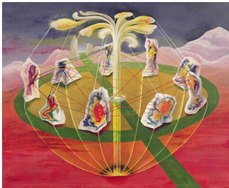
Ithell Colquhoun, La Danza de los Nueve Ópalos , 1942. Óleo sobre lienzo, 51 x 69 cm. The Sherwin Collection, Leeds, UK / Bridgeman Images

Del acta de inauguración de la Escuela Nacional de Agricultura (ENA) en los terrenos de la Hacienda de Chapingo del 20 de noviembre de 1923, retomo el último párrafo: