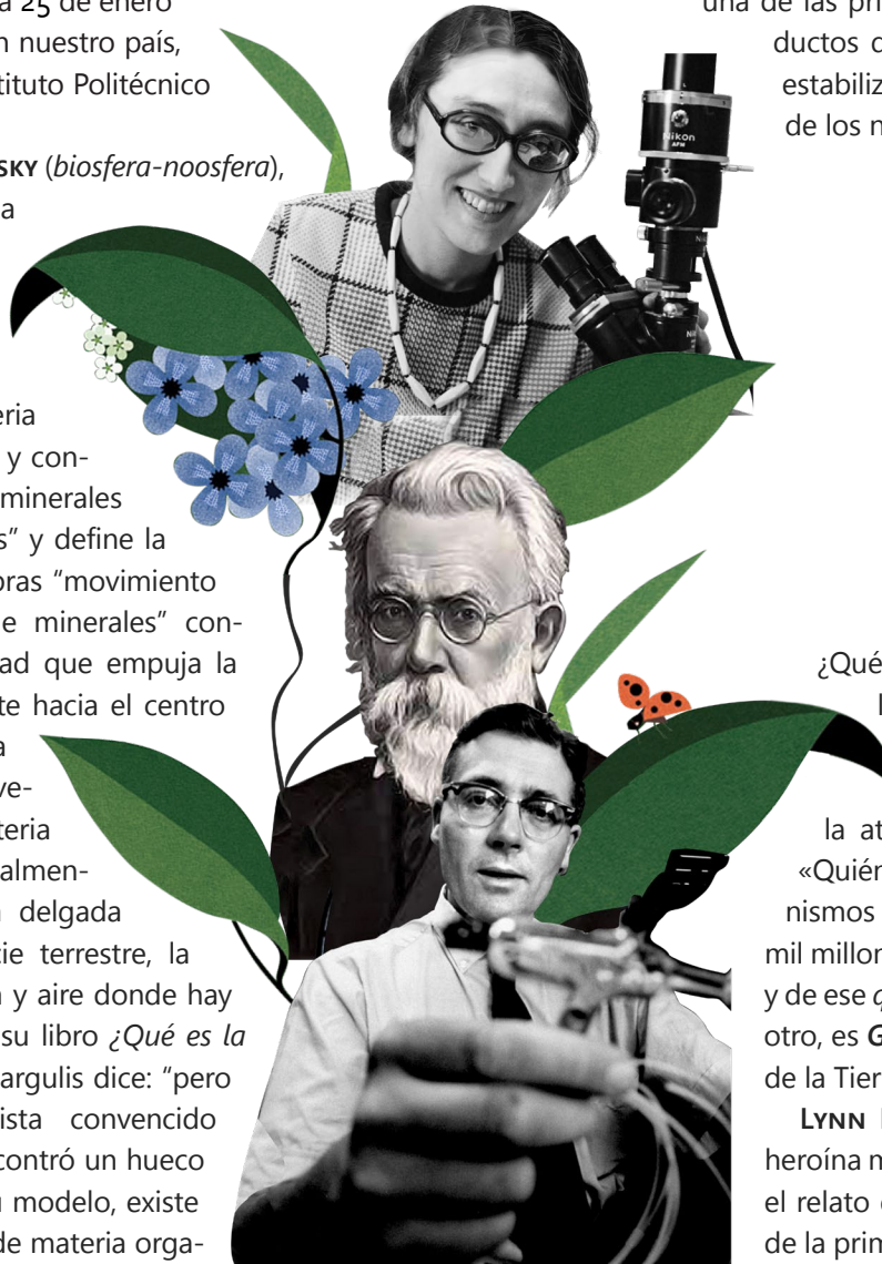
De arriba a abajo: Lynn Margulis, Vladimir I. Vernadsky y James Lovelock

"Aunque la primera parte de la historia, la fusión de las veloces espiroquetas con células bacterianas de mayor tamaño, no es universalmente aceptada, las partes segunda y tercera de esta relato que tiene que ver con la fusión de seres primitivos para