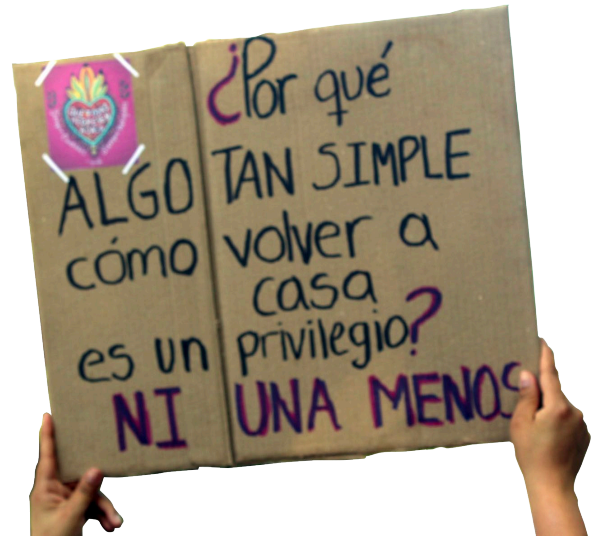
Cartel de una de las estudiantes asistente a la marcha.