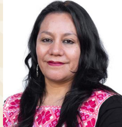
Mtra. María Luisa Albores G. (Titular de la Semarnat)