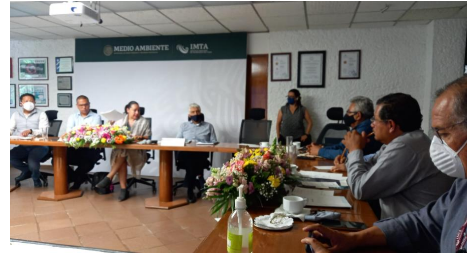
Reunión en el IMTA