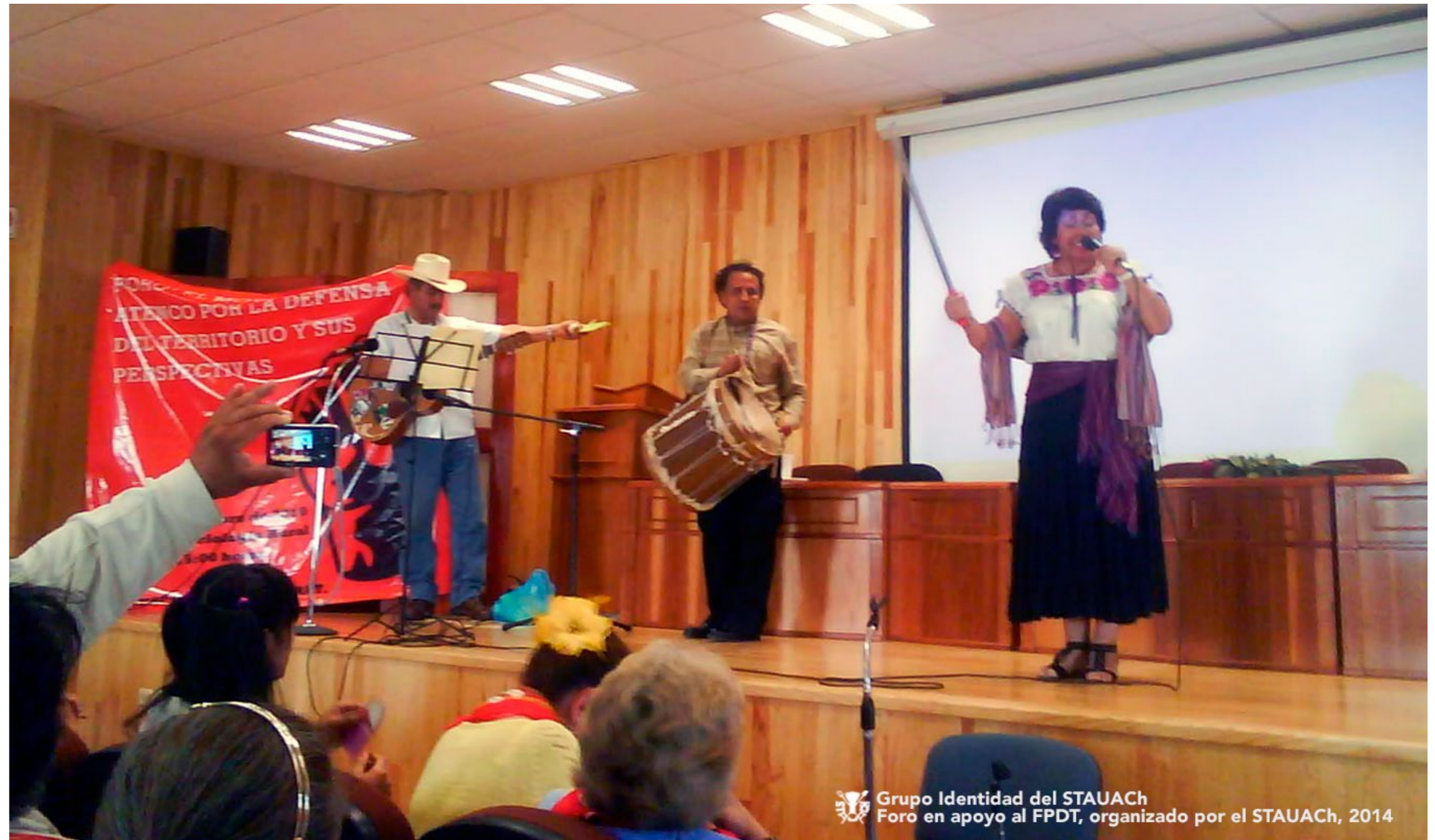
Grupo Identidad del STAUACH Foro en apoyo al FPDT, organizado por el STAUACH, 2014

El hartazgo en todos los rincones de la república mexicana contra los gobiernos Panistas y el regreso de los Priistas (2000-2018) fue contundente, ante este cambio de gobierno se inició la campaña YoprefieroElLago, con un pensamiento crítico se le tomó la palabra al nuevo presidente, y con trabajo impresionante de reflexión, debate y sobre todo con una estrategia de comunicación se participó en la consulta que inició el jueves 25 de octubre y terminó el domingo 28 de octubre de 2018, los resultados fueron contundentes La Fundación Arturo Rosenblueth, realizadora de la encuesta, detalló en un millón 67 mil 859 participantes. Un total de 310 mil 463 participantes votaron por continuar la obra